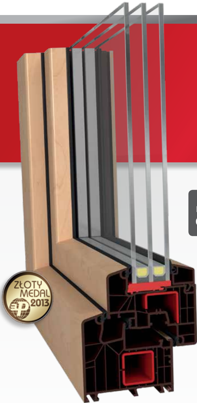
IDEAL 8000 Classic-line | 85 mm