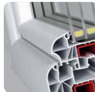
nietuzinkowy design i trzy nowoczesne linie stylizacji okna