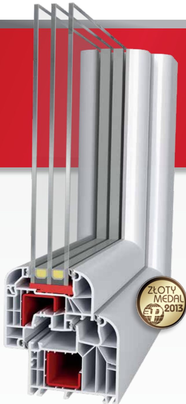
IDEAL 8000 Round-line | 85 mm