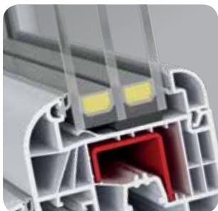
technologia klejonej szyby „bonding inside” to szereg dodatkowych korzyści

Na przykład, okno referencyjne o wymiarach 1230 mm x 1480 mm, przy zastosowaniu pakietu szybowego o współczynniku U_g=0,5 \text{ W/m}^2\text{K} osiąga współczynnik izolacji termicznej wynoszący U_w=0,76 \text{ W/m}^2\text{K} . To nawet o 45% lepsze właściwości niż w przypadku najczęściej kupowanych okien na bazie profili pięciokomorowych z szybą o współczynniku U_g=1,1 \text{ W/m}^2\text{K} .